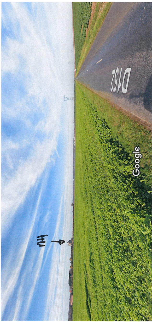
Date de l'image : nov. 2021